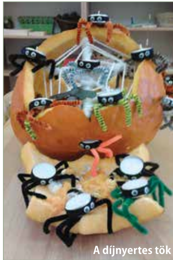
A díjnyertes tök

Sokat gondolkodtam, mit is faraghatna a Barackfa csoport ebben az évben. Próbáltam gyerekek fejjel gondolkodni, vajon mi tetszene nekem és más gyerekeknek is... aztán beugrott minden gyerek szereti az izgó-mozgó bogarakat! Ezt tovább gondolva jött az ötlet legyenek mécses pókok, mert minél több mécses ég, a tök annál látványosabb. Így született meg a pókfészek, ami önmagáért beszélt!