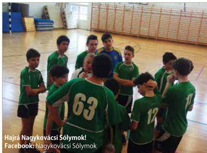
Hajrá Nagykovácsi Sólymok! Facebook: Nagykovácsi Sólymok

Általános Iskolás ifjancaink Diákolimpiai szereplésüket a Mezei elődöntőben