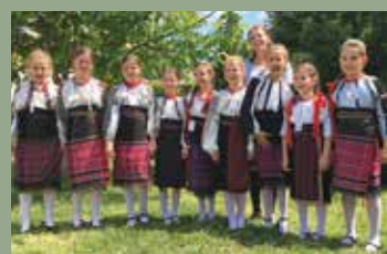
DUNÁN INNEN TISZÁN TÚL