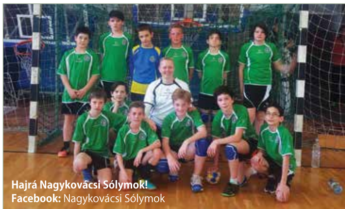
Hajrá Nagykovácsi Sólymok! Facebook: Nagykovácsi Sólymok

Május hónap az Országos Gyermekek Bajnokság lezáró hónapja. Kézis palántáink számára is eljötték az utolsó mérkőzések.