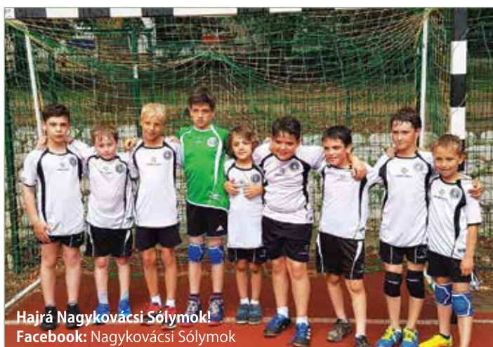
Hajrá Nagykovácsi Sóllymok! Facebook: Nagykovácsi Sóllymok

Júniusban szezonzárásra készültünk. Május végére minden Országos Gyermek Bajnokságba résztvevő csapatunk befejezte a versenyzést kiváló eredménnyel. FU14-es fiú csapatunk 3. helyezést ért el az alsóházi viadalokon. LU13-as leány csapatunk is kiváló helyezéssel zárta a szezont. Ők a felsőház 5. helyét szerezték meg maguk mögé utasítva egy nívós egyesületet. FU12-es fiú csapatunk nagy küzdelemben 1 ponttal maradt le a dobogó legfelső fokáról, így a második helyen végzett az alsóházban.