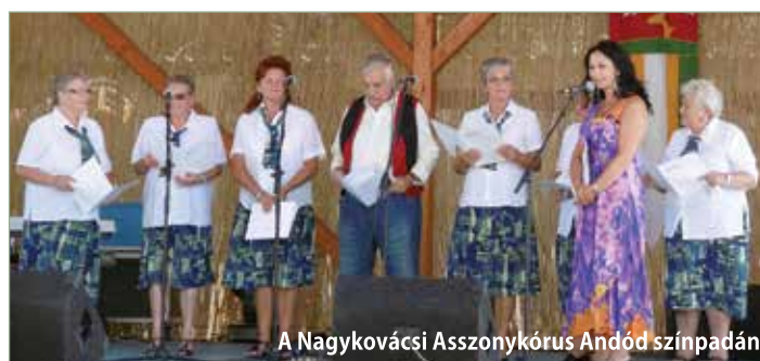
A Nagykovácsi Asszonykórus Andód színpadán