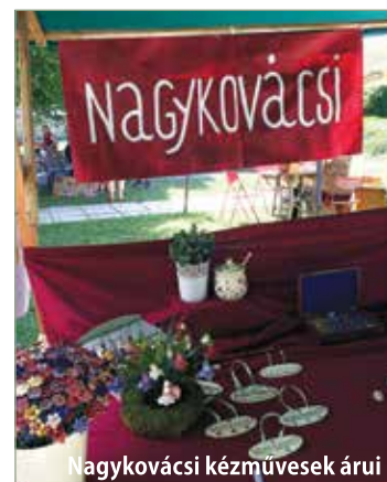
Nagykovácsi kézművesek áruja