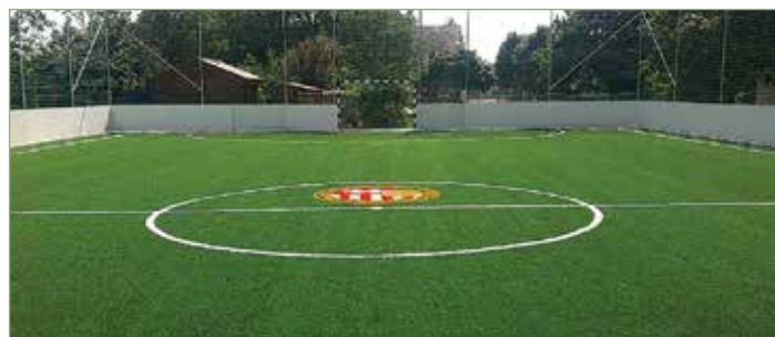
A kép egy azonos terv alapján megvalósult kispályát ábrázol.

Az MLSZ a vonatkozó közbeszerzési eljárást lefolytatta, a nyertes vállalkozással szerződést kötött. Előzetes tájékoztatásuk alapján a kivitelezésre idén augusztusban kerül sor. A pálya elkészítésének összköltsége meghaladja a 28 millió forintot.