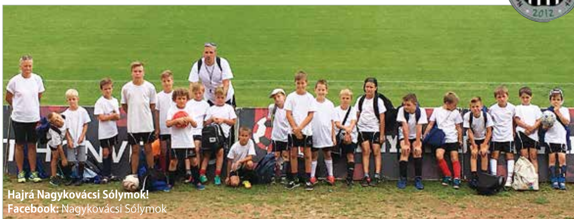
Hajrá Nagykovácsi Sólymok! Facebook: Nagykovácsi Sólymok