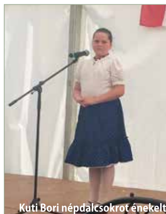
Kuti Bori népdalcsoportot énekelt