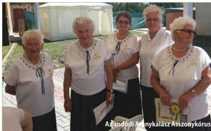
Az andódi Aranykalász Asszonykórus

Volt itt minden, ami egy falunapot igazán emlékeztetéssé tesz: barátságos futballmérkőzések, üstökben főtt egytálételek, andódi konyhákban készült finomságok, színes műsorok, és mindenekelőtt rendkívül szívélyes, szeretetteljes, baráti fogadtatás. Tartalmas beszélgetésekre és érdekes tapasztalatcserére is volt alkalom Andód, Kamocsa, Szímő és Nagykovácsi polgármesterei között.